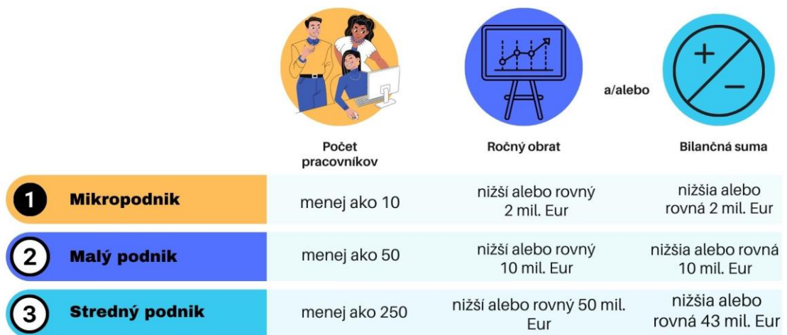
Graf č. 1: Rozdelenie podnikov podľa veľkostí

Je zrejmé, že znakov, ktorými by sme mohli určiť veľkosť podniku, je veľa. Preto sa líšia názory na určenie kritérií, ktoré by vedeli rozdeliť podniky do kategórií mikro, malý, stredný či veľký. Napriek tomu sa najčastejšie určuje veľkosť podniku meraná na základe počtu zamestnancov, ročného obratu a ročnej bilančnej sumy. 4 Tieto kritériá vychádzajú z klasifikácie, ktorú odporúča Európska komisia. Ide konkrétne o odporúčanie Európskej komisie č. 2003/361/EC, ktoré nadobudlo platnosť 1. januára 2005 a ktoré klasifikuje veľkosť podnikov podľa nasledovnej tabuľky: